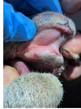
Klinische Veränderungen bei an BTV-3 erkrankten Schafen in den Niederlanden, Herbst 2023, v.l.n.r. stark speichelndes Lamm, Nekrosen im gesamten Maul und an der Dentalplatte