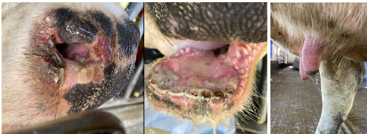
Läsionen am Flotzmaul und an den Zitzen bei an BTV-3 erkrankten Rindern in den Niederlanden, Herbst 2023