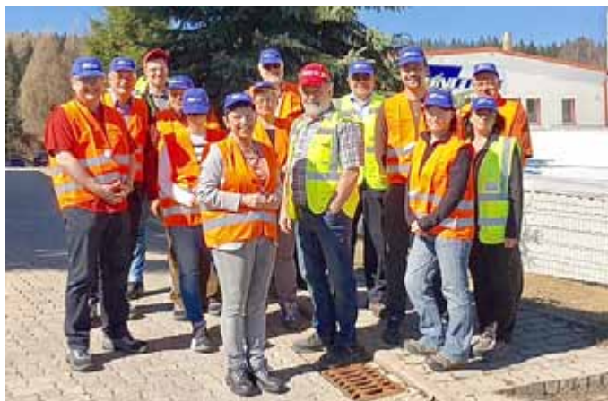
Der Umweltausschuss des Kreistages überzeugte sich vor Ort von den Emissions- und Immissionsschutzmaßnahmen.

Diese Beschwerden griff wiederum das Umweltamt des Landkreises Sonneberg auf und setzte dem Unternehmen im Nachgang von Kontrollen eine Frist, um die bestehenden Elektrofilter durch leistungsfähigere zu ersetzen. Dem kam das Unternehmen nach, indem es über den Jahreswechsel eine komplett neue Abgasfil-